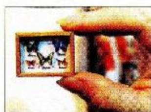
PERFECCION ▶ En mariposas