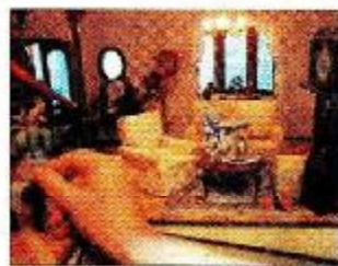
DETALLES ▶ Orden en el living

dos a 15 habitaciones-, el experto es Ricardo, que las construye en tres caras cerradas y con una de vidrio abierta para poder espíar. Se pueden empapelar las paredes, alfombrar los pisos, elegir herrajes y molduras adecuados y hasta conectar la electricidad.